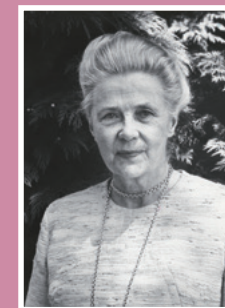
Porträtt av Alva Myrdal. Fotograf: Ursula Assmus, 1970. (KB, KoB Fc. 2)

i Alva Myrdal föddes Reimer den 31/1 1902 i Uppsala och avled den 1/2 1986 i Danderyd.