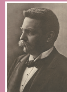
Porträtt av Hjalmar Branting, 1910-talet.

Alva Myrdal var 1949–50 chef för FN:s avdelning för sociala frågor och 1951–55 för Unescos socialvetenskapliga avdelning. Hon var Sveriges ambassadör i Indien 1956–61. 1966–73 var hon statsråd i den socialdemokratiska regeringen.